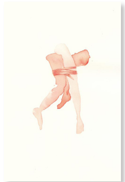
• Dessin au lavis, 22/30 encadré